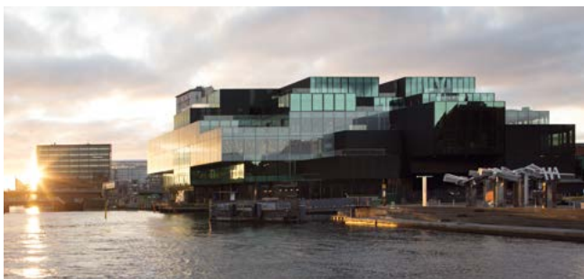
BLOX, Kopenhagen, Dänemark, 350 PKW, öffentlich